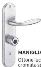
MANIGLIA Ottone lucido o cromata spazzolata