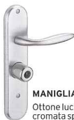
MANIGLIA Ottone lucido o cromata spazzolata